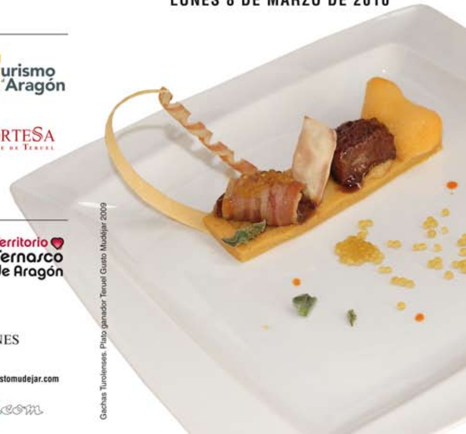
Gachas Teruelenses. Plato ganador Teruel Gusto Mudejar 2009